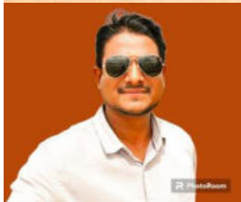
MAPS ACTIVITY CREATED BY ABDUL WAJID.SA.SS.ZPSS ECHODA UM